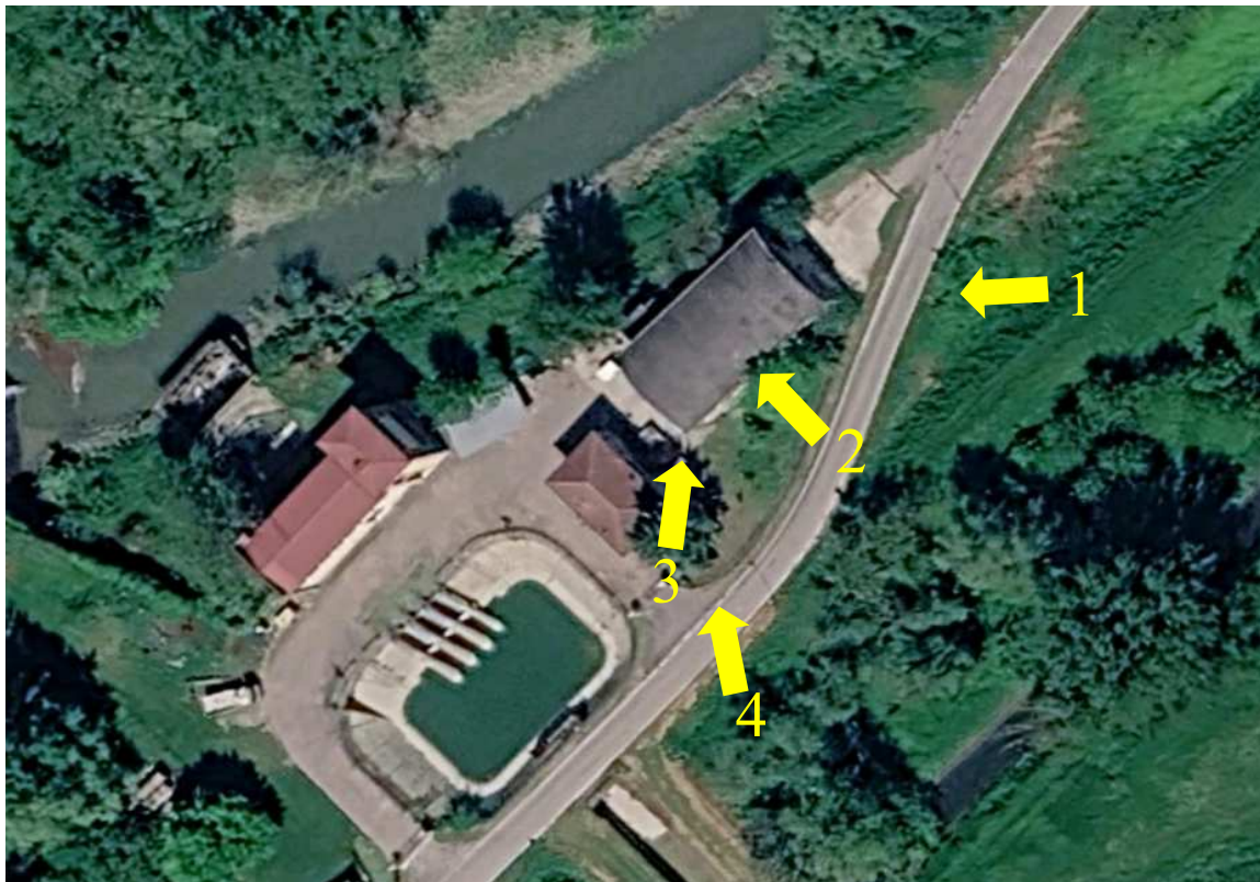
Foto aerea con evidenziati i punti di presa fotografici