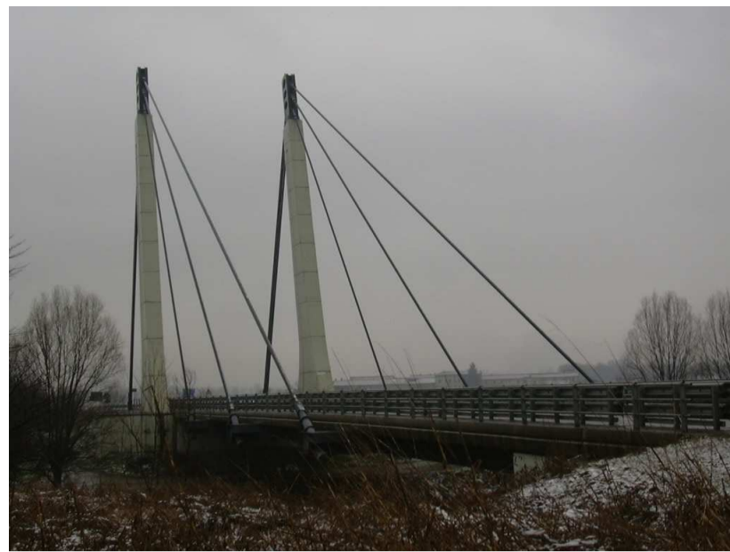
Ponte strallato sul fiume Oglio