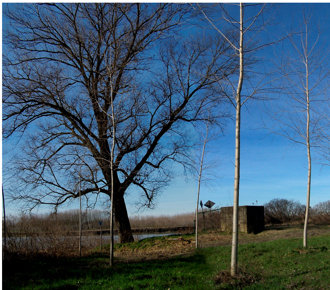
Ripresa n° 12 – il pioppo nero monumentale che segna l'accesso al pennello