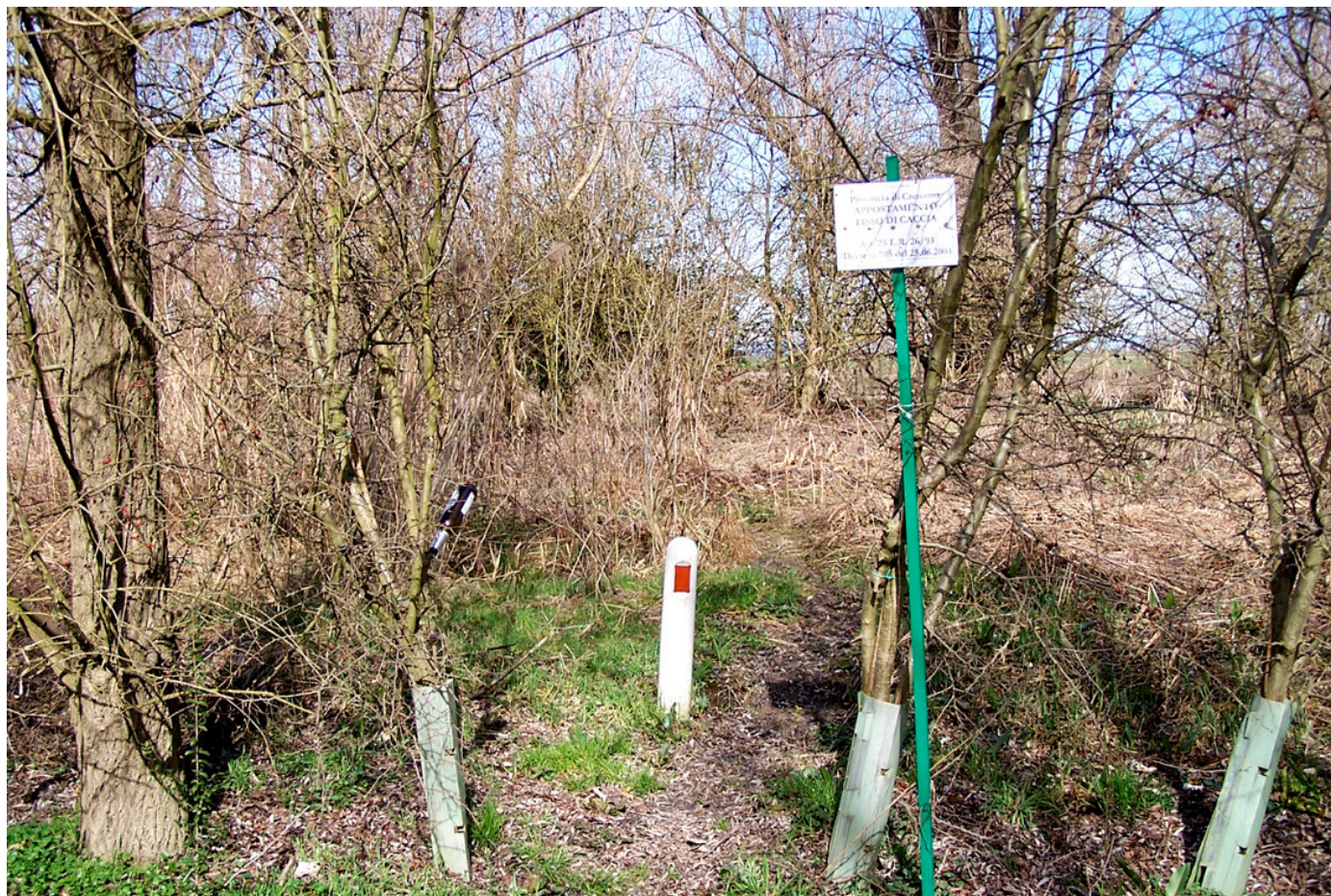
Ripresa n° 17 – l'accesso all'appostamento fisso di caccia sull'isola