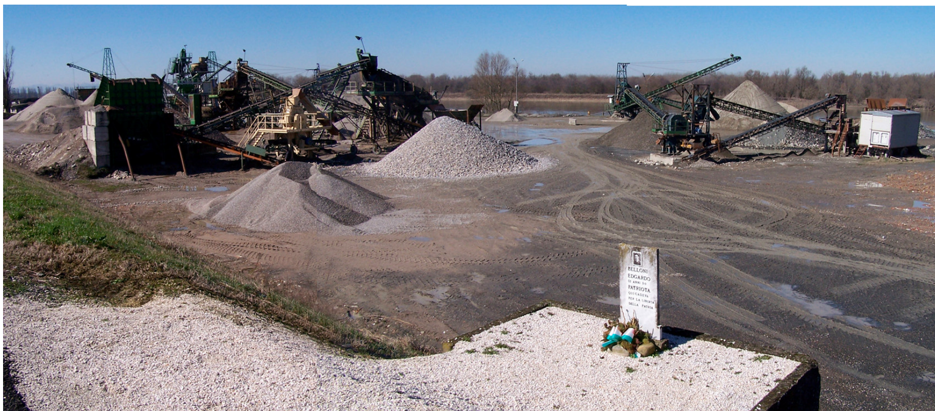
Ripresa n° 27 – Il centro lavorazione inerti e una lapide commemorativa davanti all'isola, in provincia di Parma (Colorno)