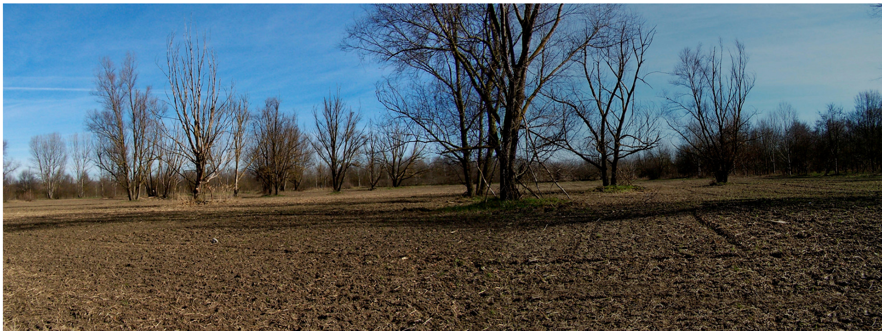
Ripresa n° 5 – Ampia radura con Salice bianco sull'isola