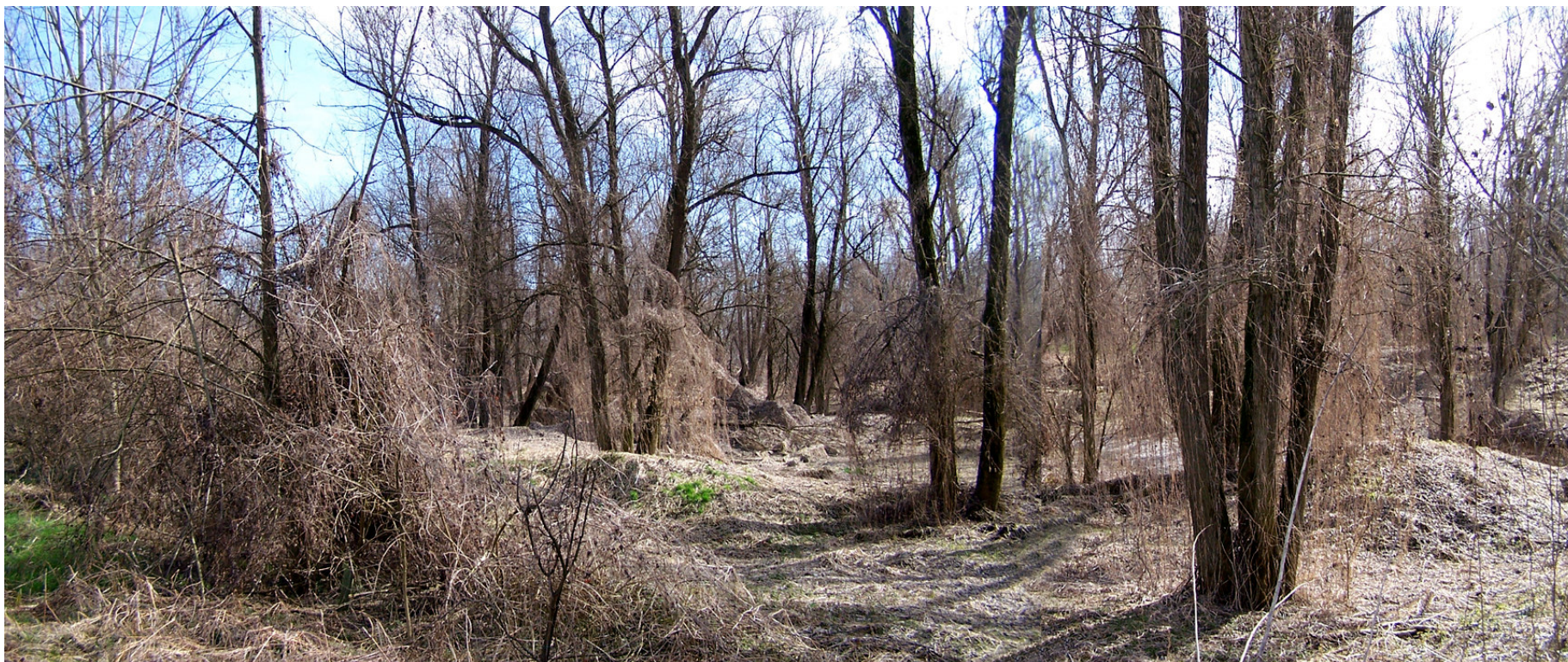
Ripresa n° 2 – L'habitat 91E0