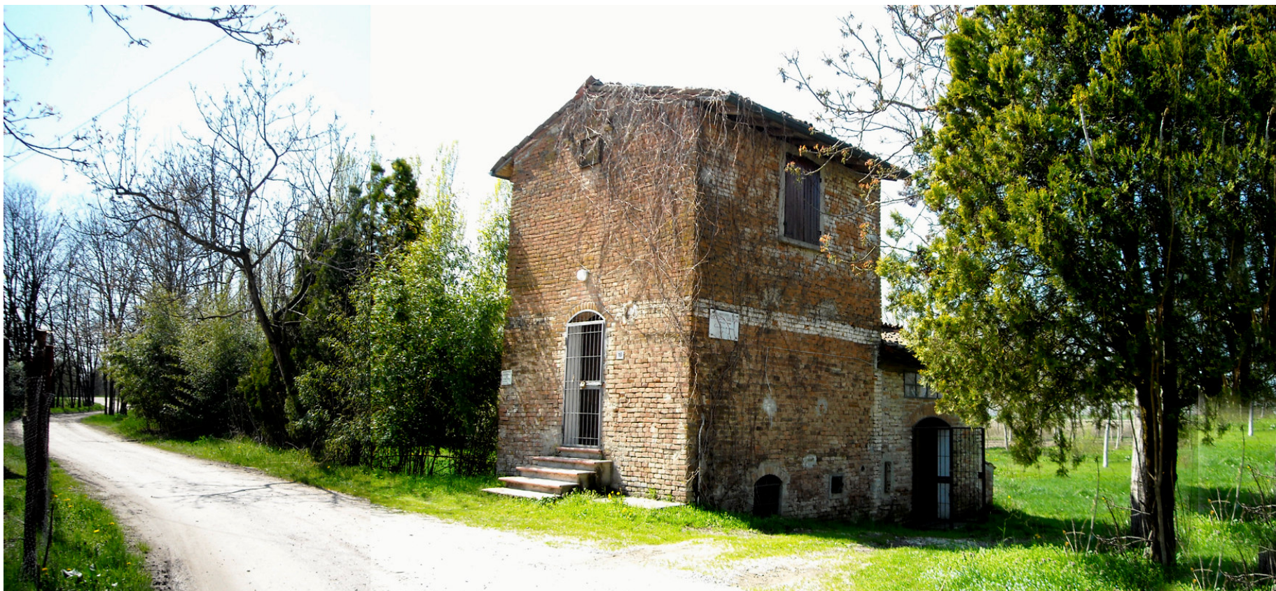
Ripresa n° 38 – Il fabbricato esistente in prossimità della ZPS, oggi a servizio del centro di AMA Onoterapia.