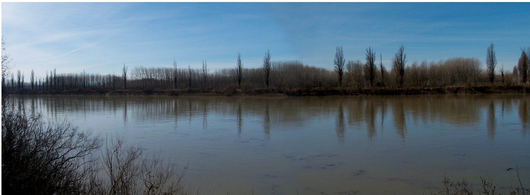
Ripresa n° 6 – Il Po e la sponda opposta vista dall'isola con i resti del vecchio filare di pioppi cipressini