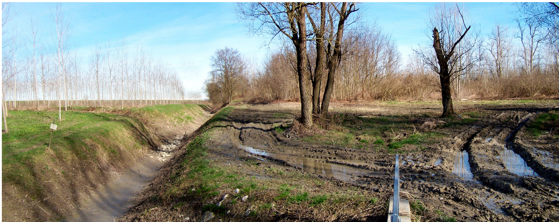
Ripresa n° 14 – il tratto terminale del Riolo in inverno, totalmente privo di acqua.