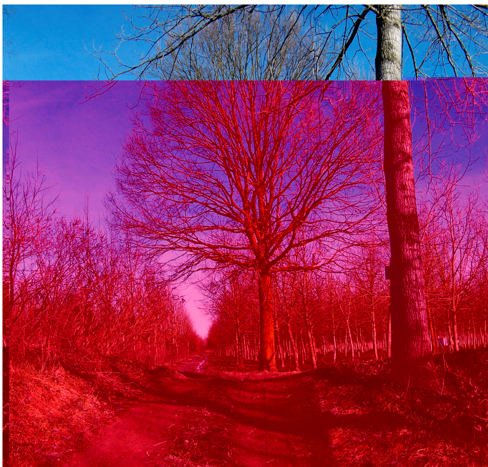
Ripresa n° 15 – Argine comprensoriale, limite nord della ZPS e la farnia che ne segna il confine