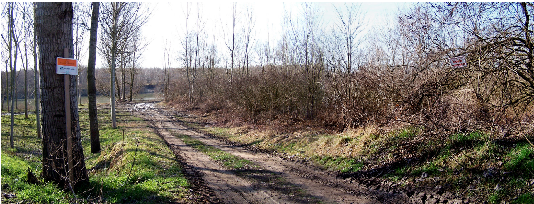
Ripresa n° 16 – Accesso alla ZPS dall'argine comprensoriale