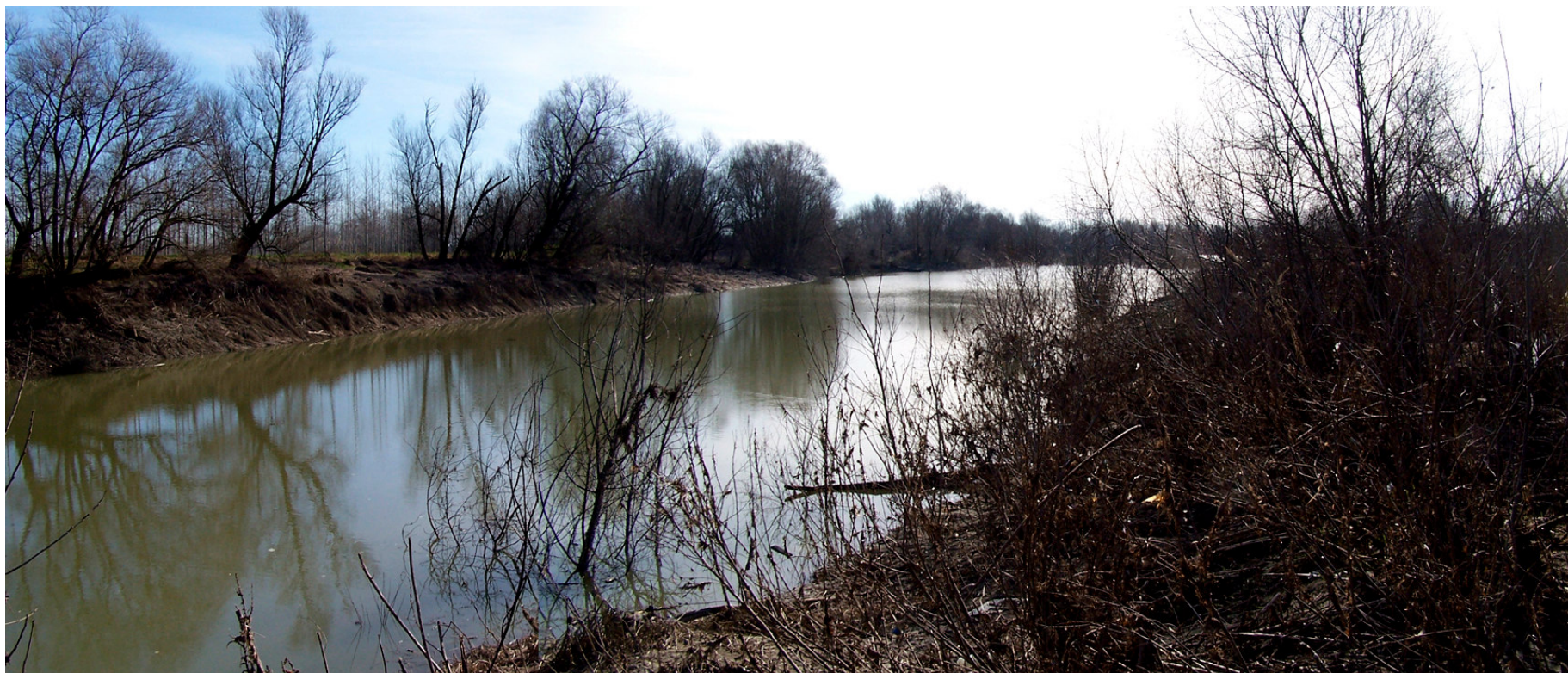
Ripresa n° 10 – La lanca del pennello