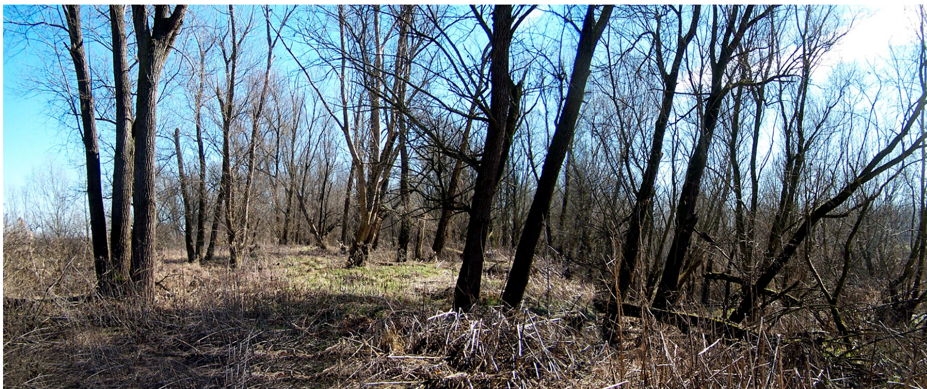
Ripresa n° 32 – il tratto iniziale dell'habitat 91E0 sul pennello di difesa idraulica.