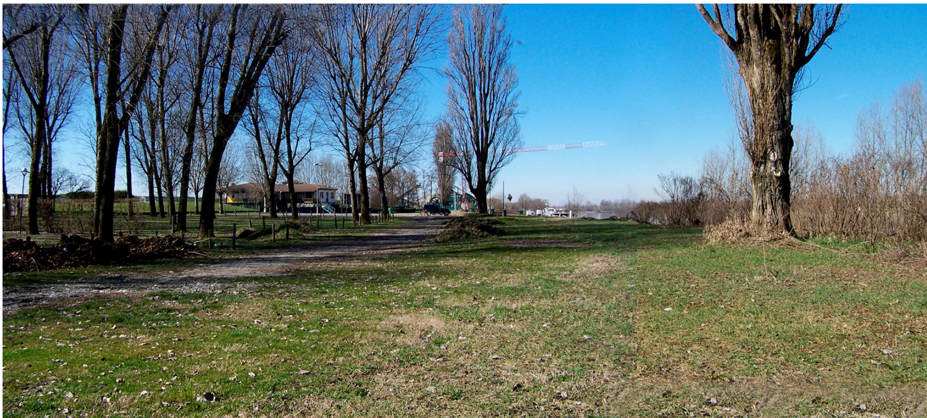
Ripresa n° 37 – La pizzeria lo Storione e la zona attrezzata antistante, al limite ovest della ZPS, già in provincia di Parma (Coltaro)