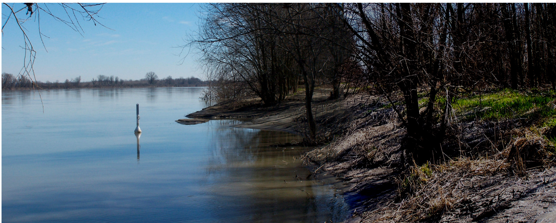
Ripresa n° 36 – La riva del Po, sullo sfondo l'isola Maria Luigia, riconoscibile dal pioppo nero monumentale all'attaccatura del pennello.