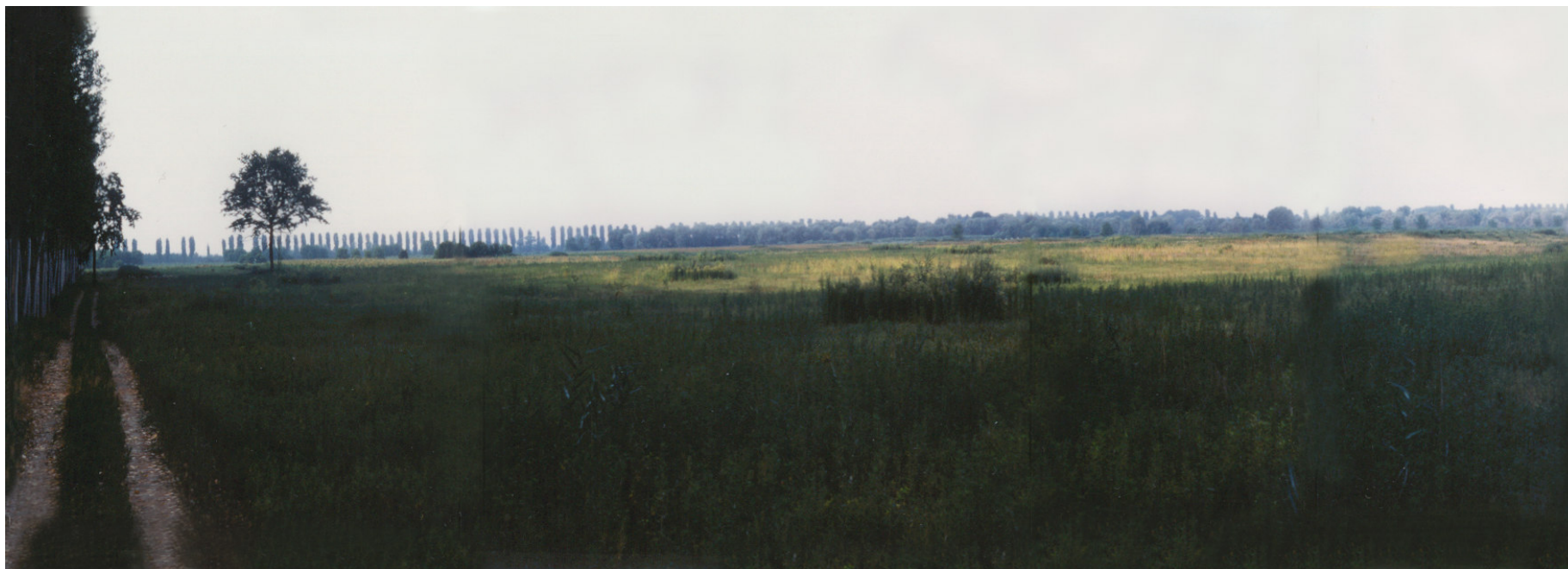
1997 – la parte nord ovest dell'isola due anni dopo il taglio del pioppeto