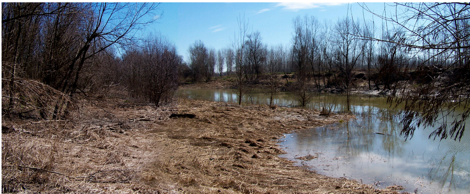
Ripresa n° 33 – Habitat 91E0 al bordo della lanca interna.