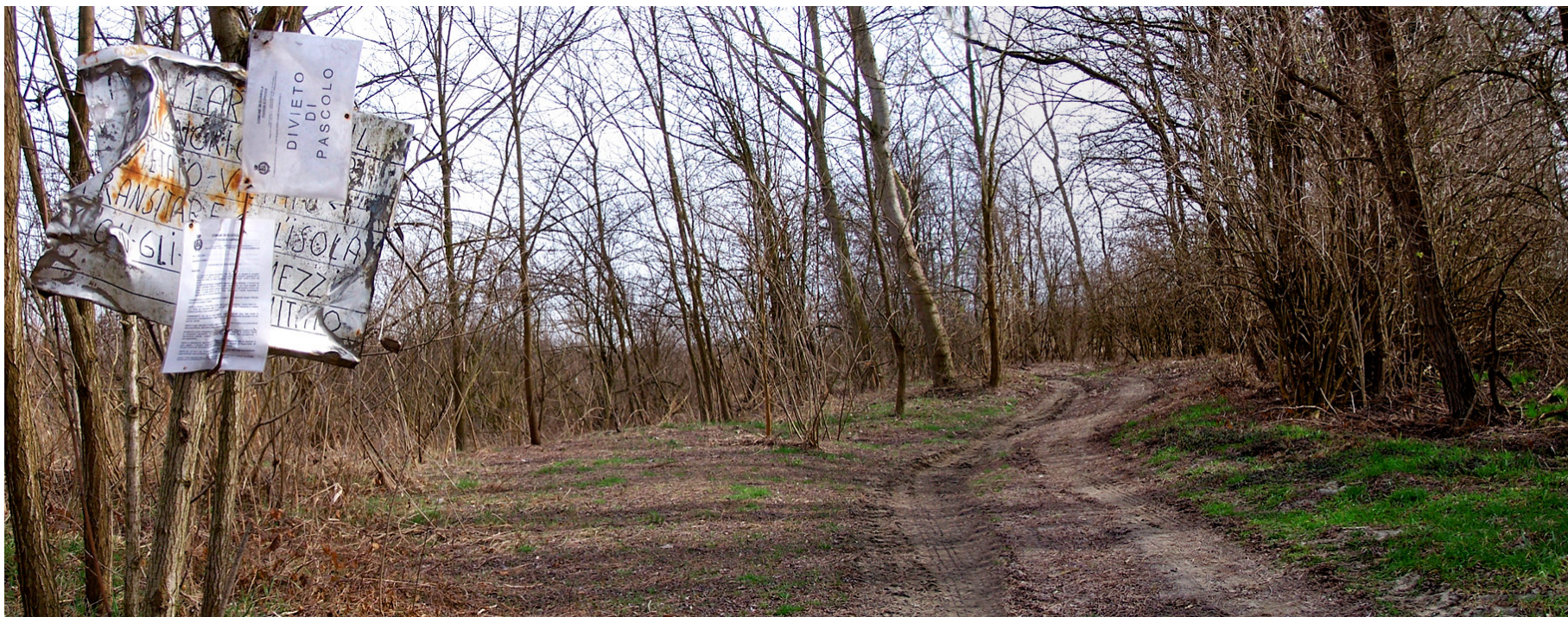
Ripresa n° 1 – l'accesso all'isola con i cartelli di divieto di pascolo e di transito con mezzi motorizzati (ATC)