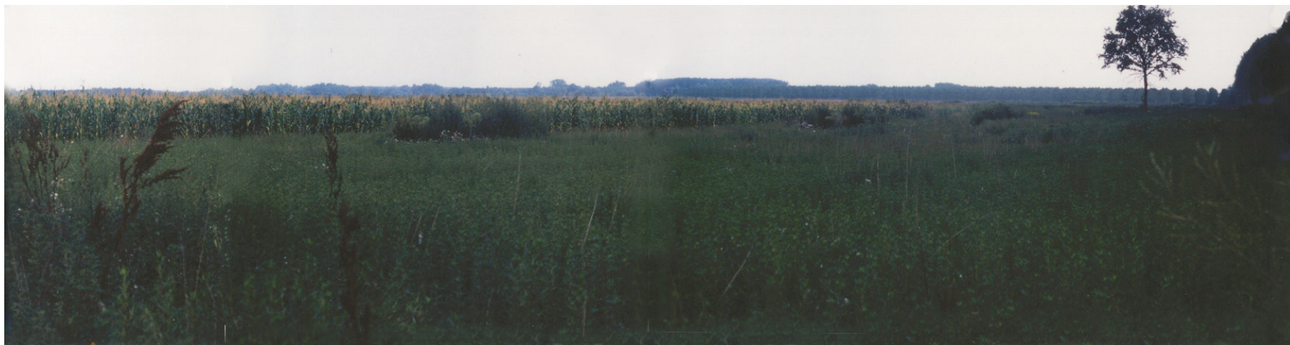
1997 - la parte sud ovest dell'isola occupata da seminativi di mais