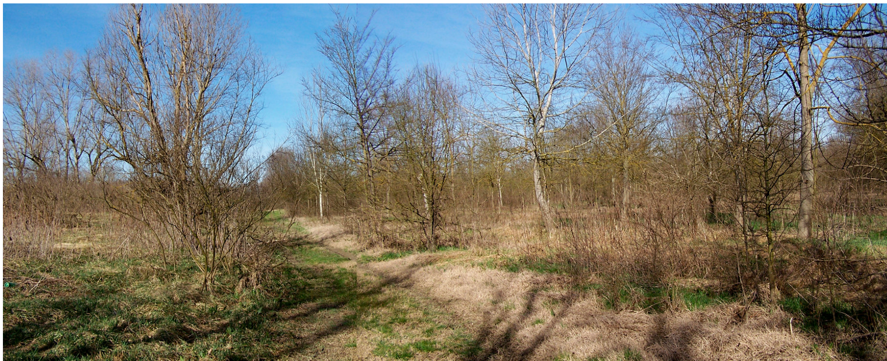
Ripresa n° 4 – Uno scorcio dell'impianto forestale del 2000 sull'isola