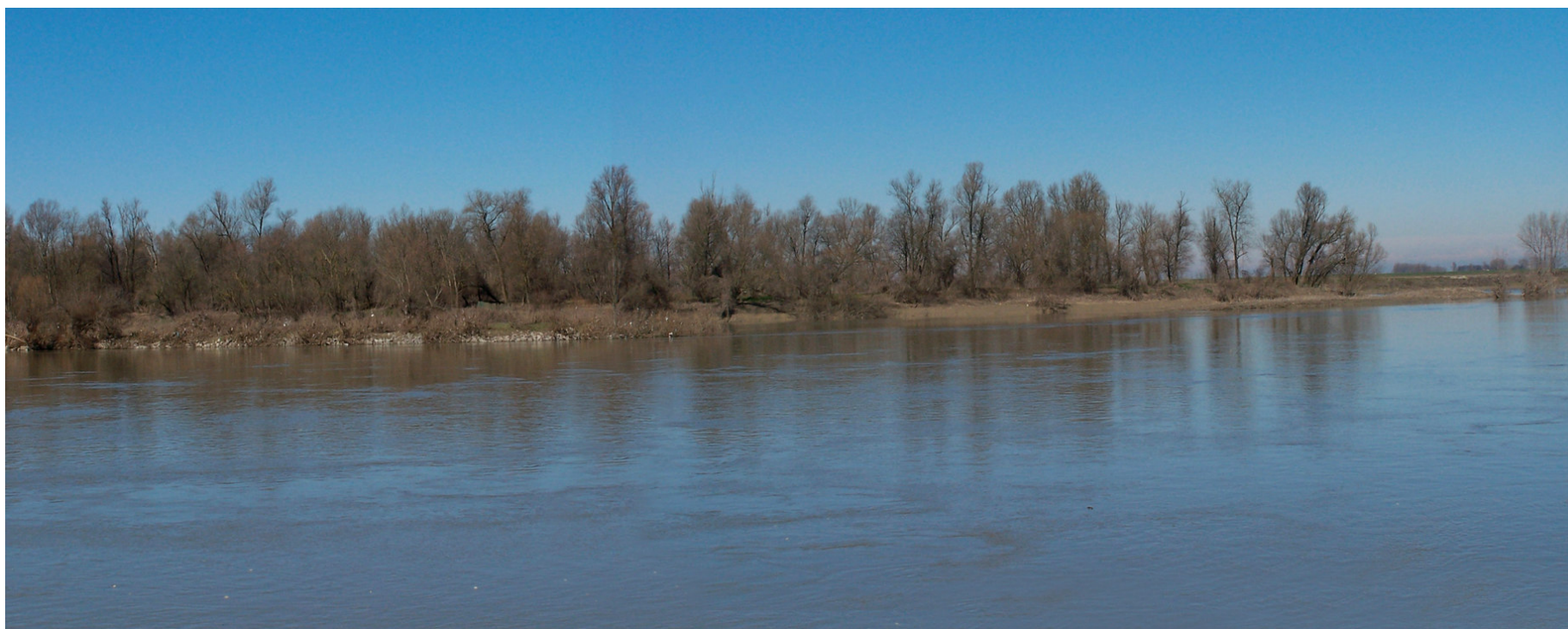
Ripresa n° 28 – L'habitat 91E0 nella parte terminale dell'isola Maria Luigia