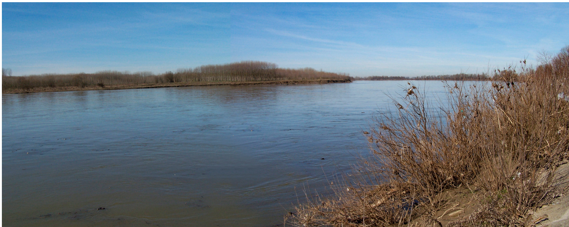
Ripresa n° 9 – Il Po visto dal pennello nel suo tratto interno alla ZPS