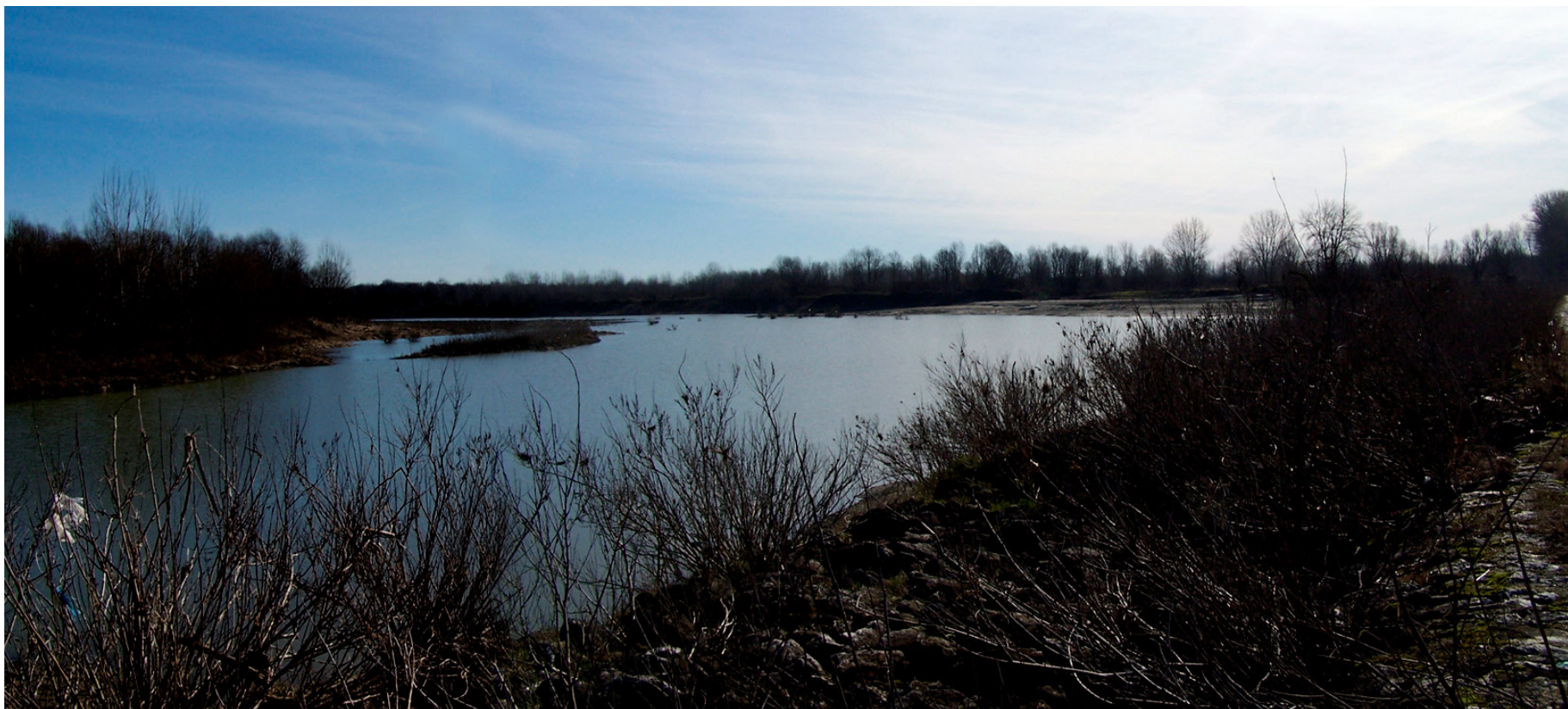
Ripresa n° 8 – La lanca del pennello sullo sfondo l'area dell'habitat 3270