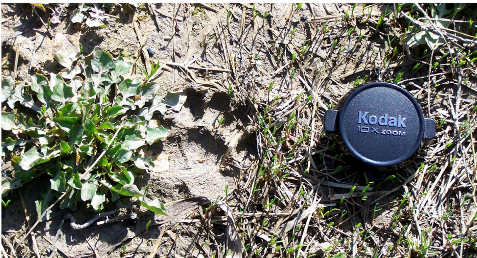
Ripresa n° 22 – probabile impronta di tasso ( Meles meles ) sull'isola