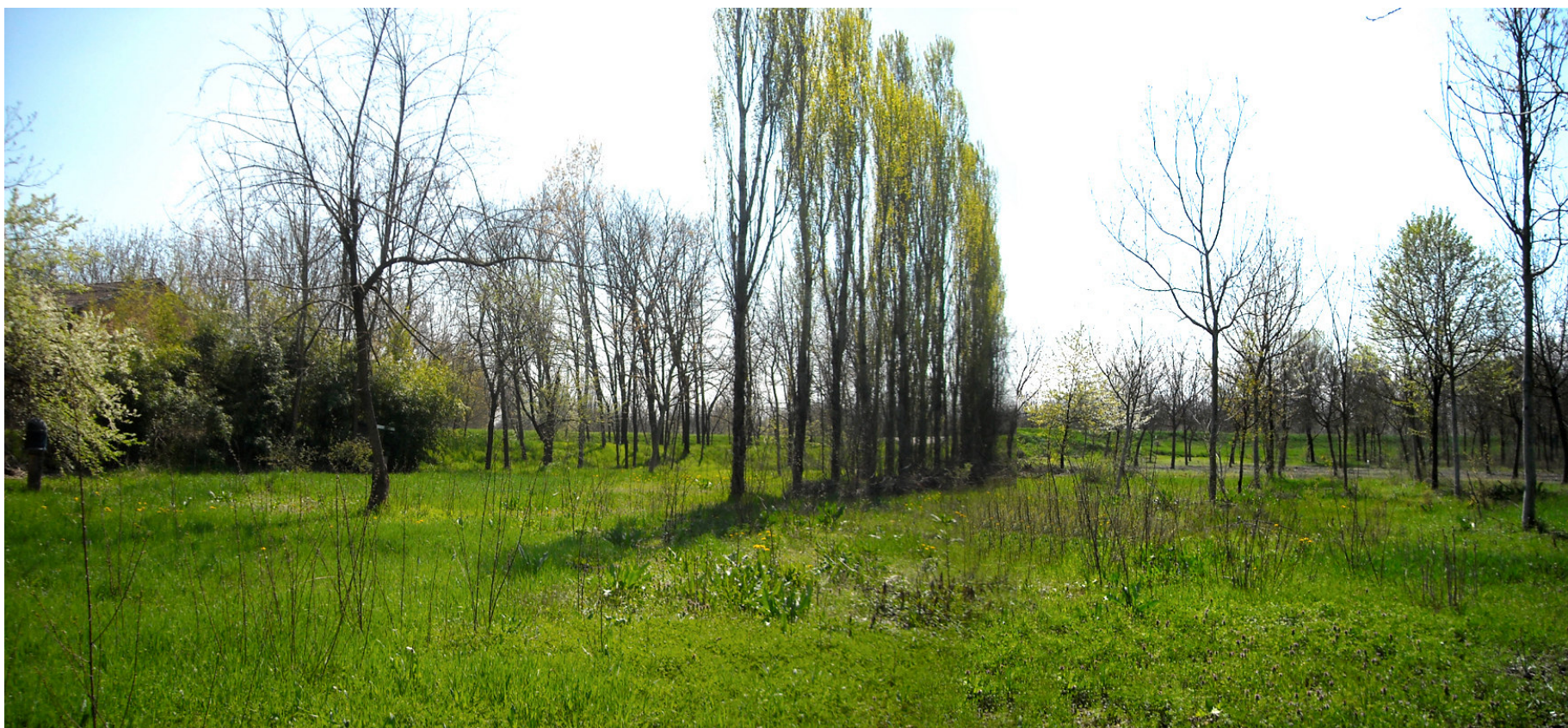
Ripresa n° 39 – interventi di diversificazione ambientale eseguiti nella golena protetta, appena fuori della ZPS.