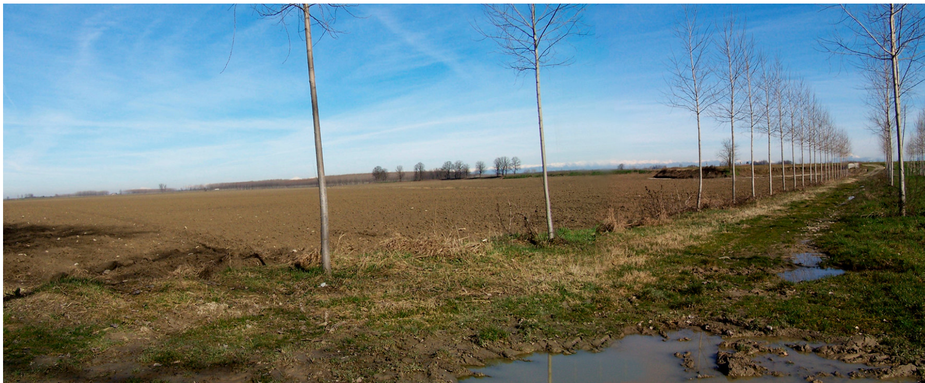
Ripresa n° 11 – La parte nord ovest della ZPS, completamente destinata a seminativi