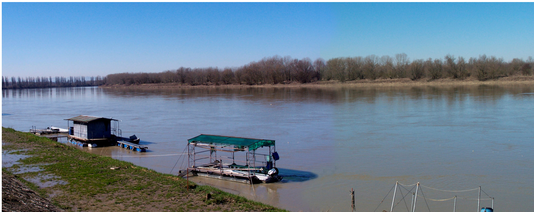
Ripresa n° 23 – Habitat 91E0 integrato con l'impianto forestale