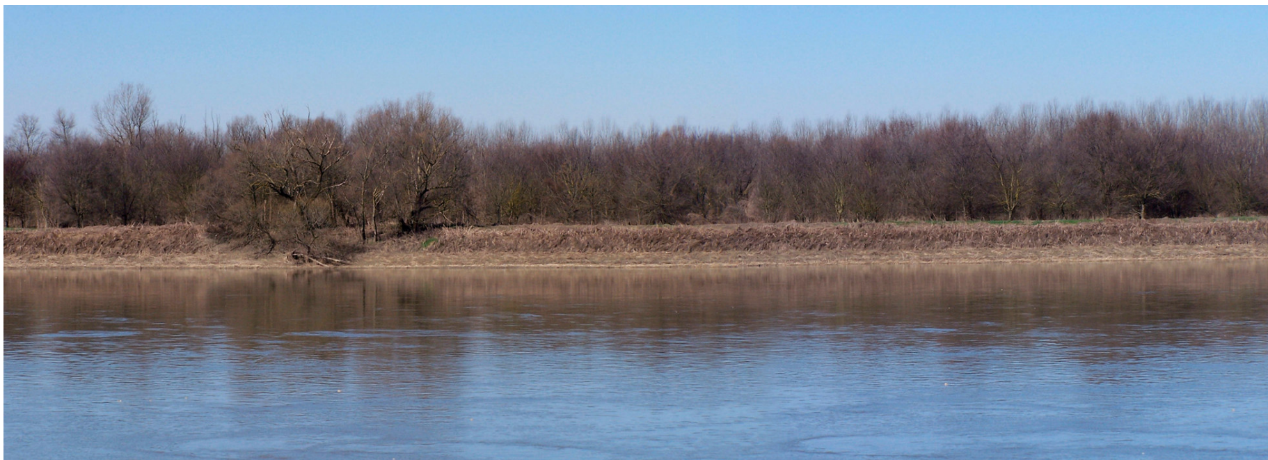
Ripresa n° 25 – L'impianto forestale sull'isola visto dalla sponda opposta