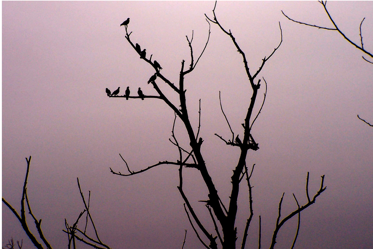
Ripresa n° 18 – Colombacci su un salice ormai morto