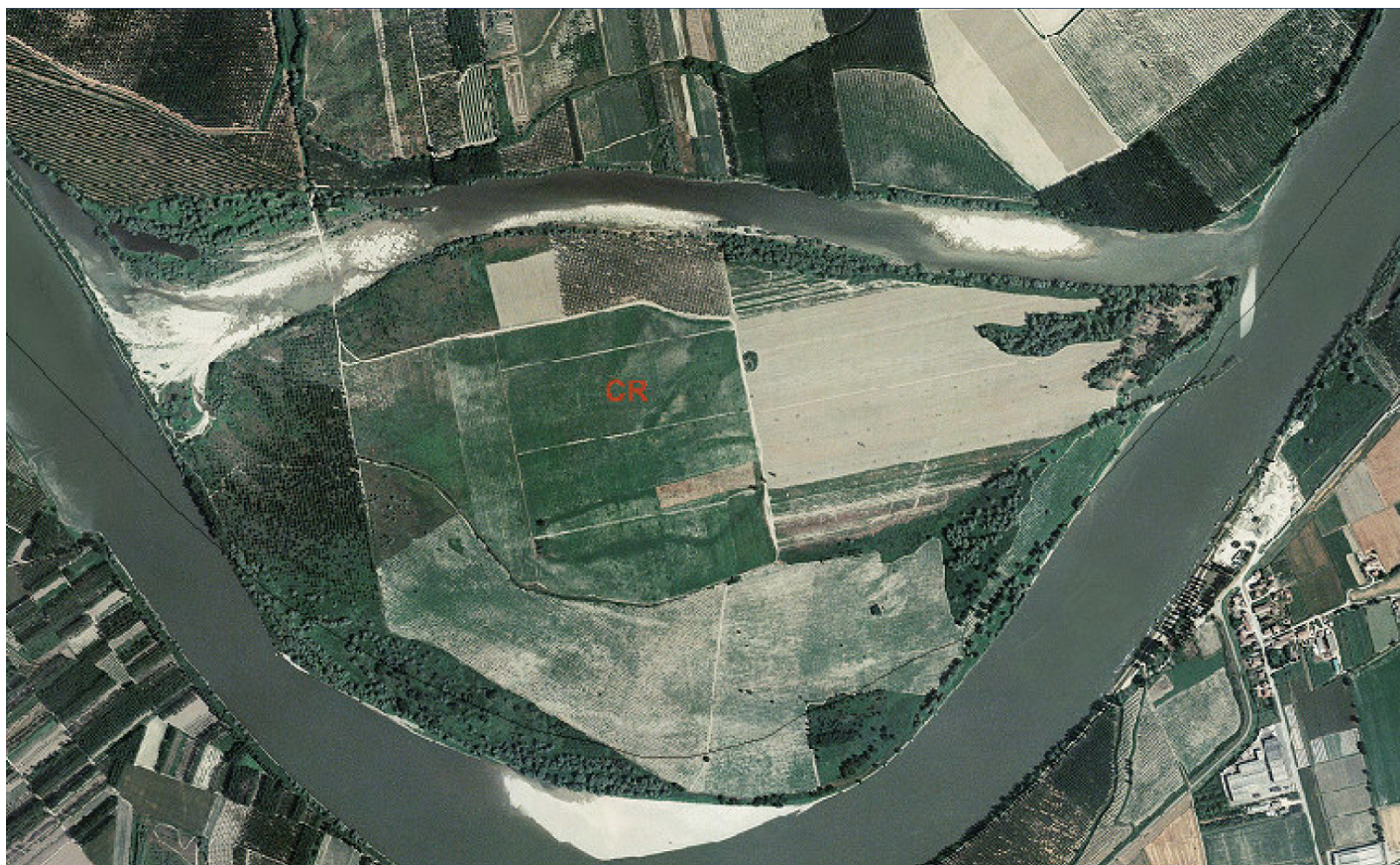
Ortofoto 1998