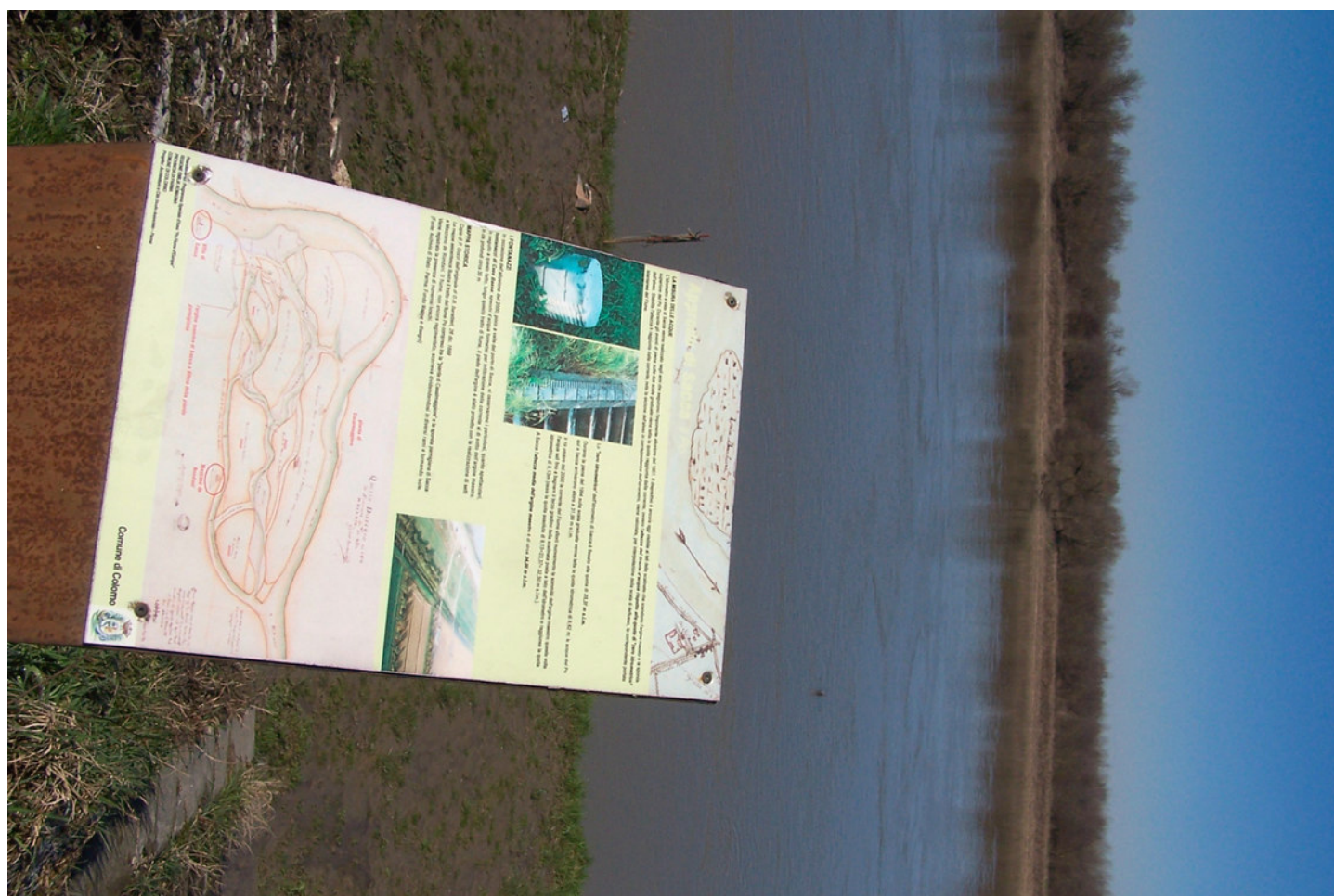
Ripresa n° 26 – l'area comunale di Colorno PR antistante l'isola e un pannello didattico