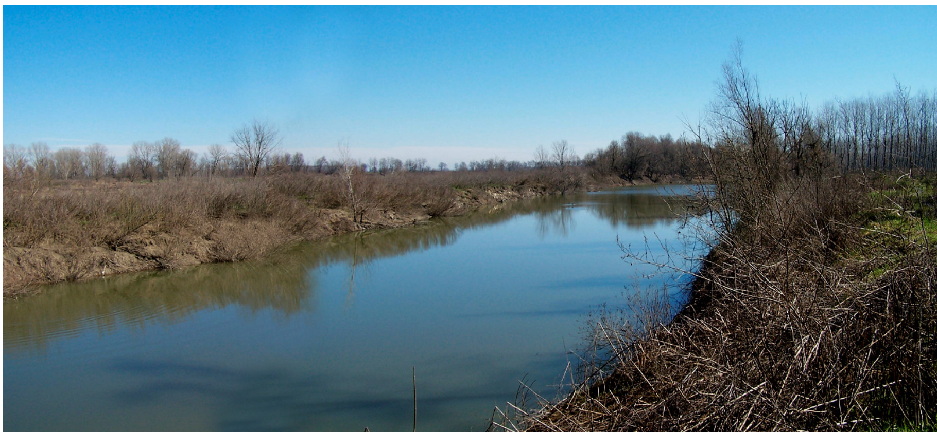
Ripresa n° 30 – il tratto iniziale della lanca del Pennello.