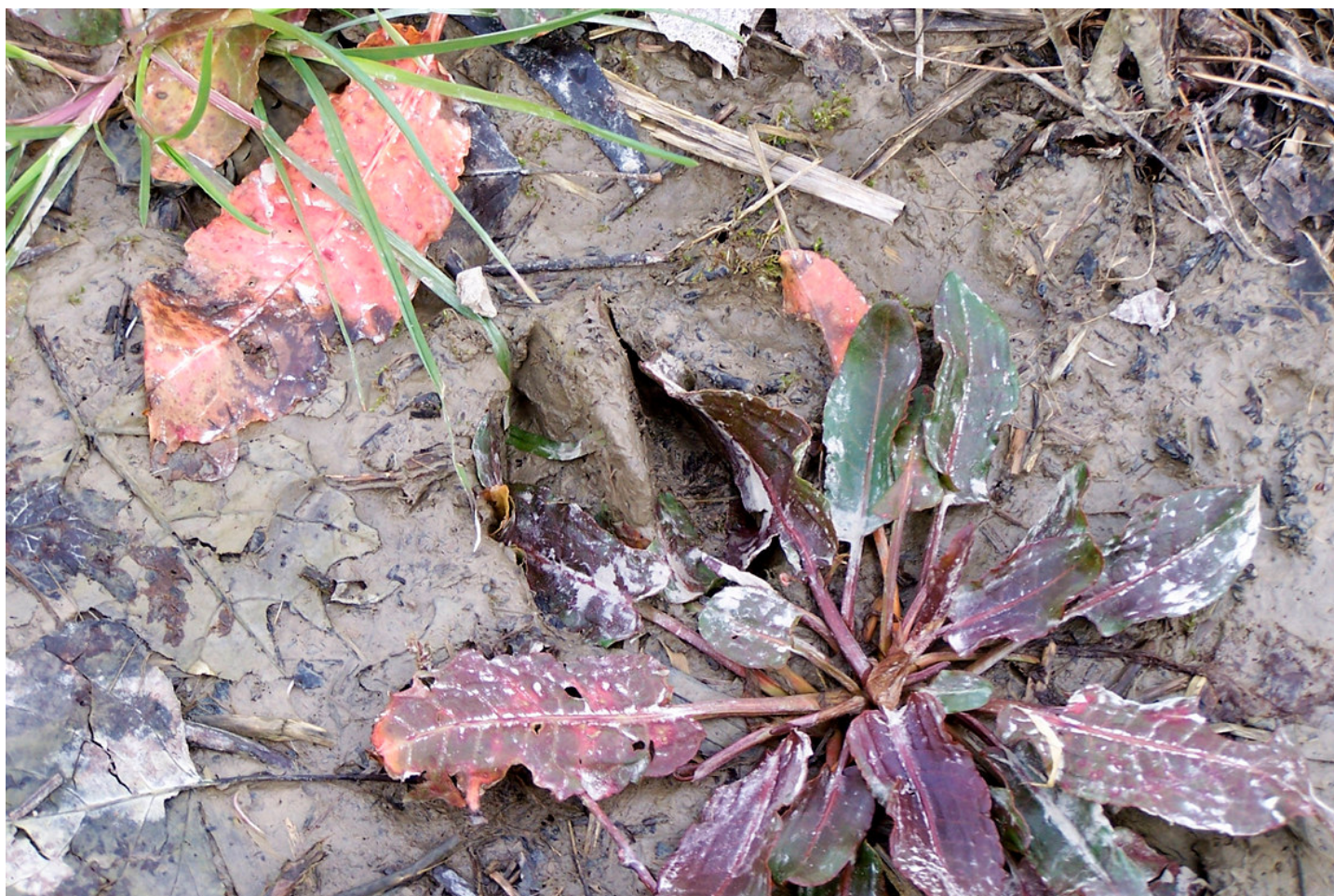
Ripresa n° 20 – impronta di capriolo ( Capreolus capreolus ) sull'isola