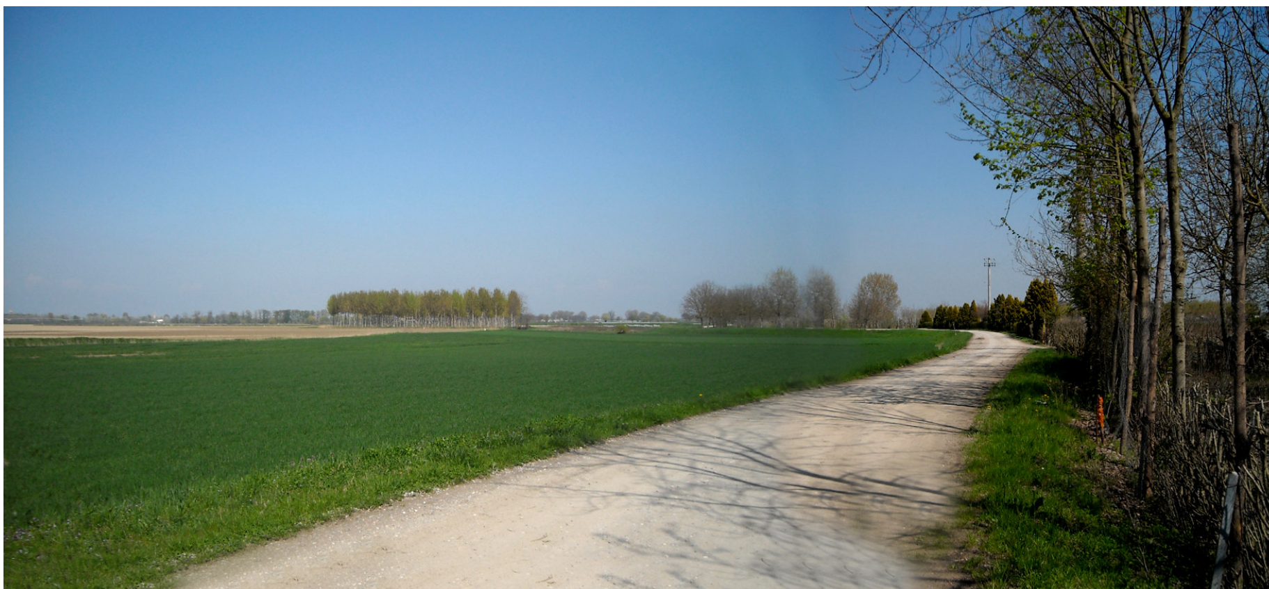
Ripresa n° 41 – La strada di accesso alla ZPS nel suo tratto terminale, prima dell'argine comprensoriale