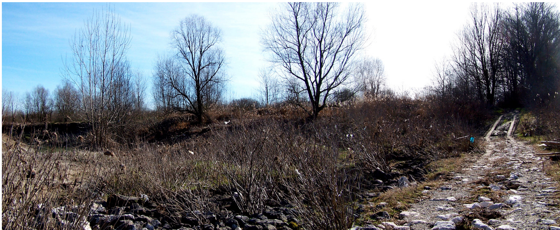
Ripresa n° 7 – l'accesso all'isola al termine del pennello