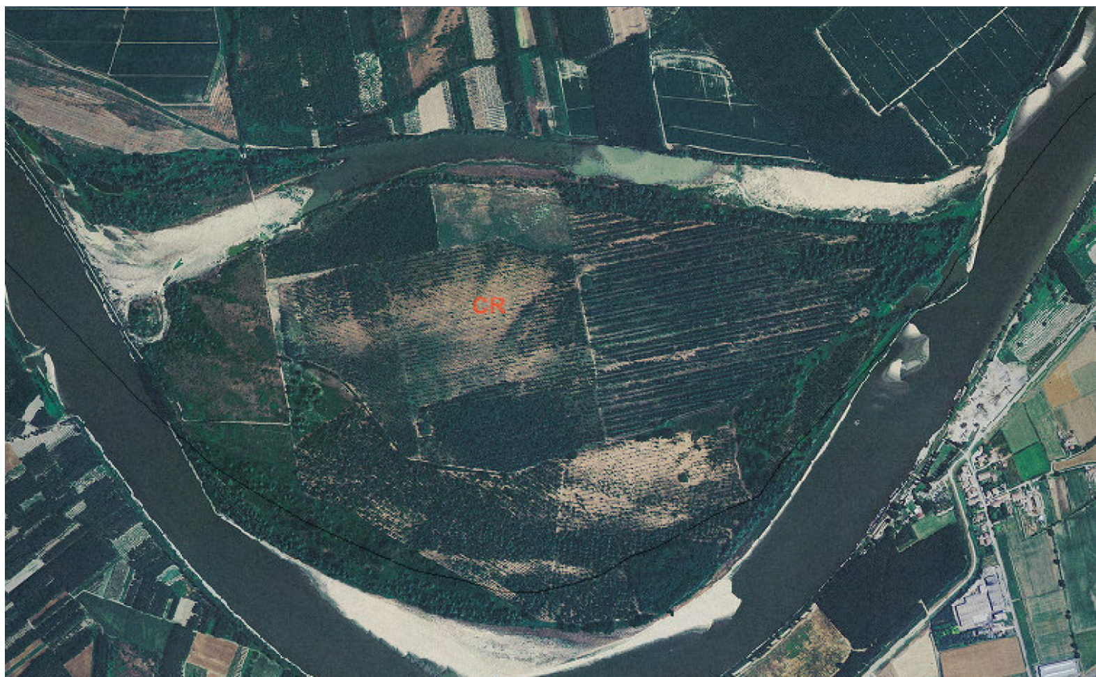
Ortofoto 2007