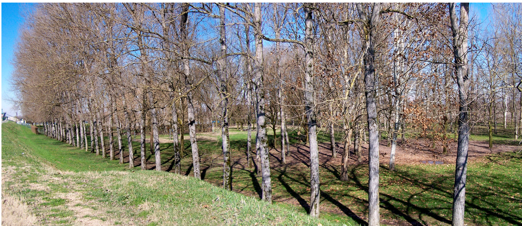
Ripresa n° 29 – Alberature della golena nell'area attrezzata al limite ovest della ZPS in provincia di Parma (Coltaro).