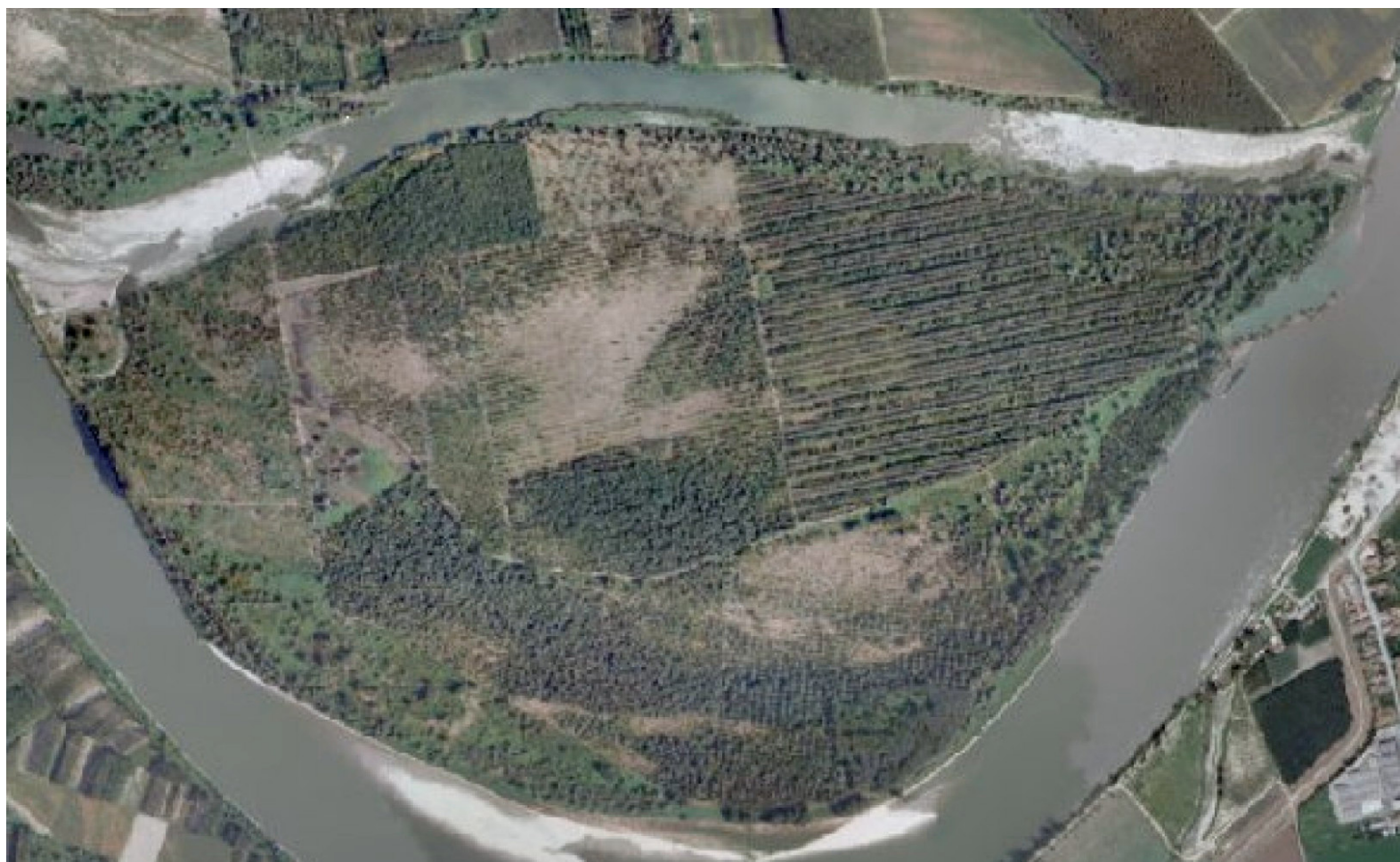
Ortofoto 2008 (Regione Emilia Romagna)