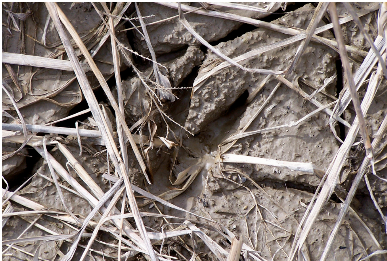
Ripresa n° 19 - impronta di capriolo ( Capreolus capreolus ) sul fango della riva