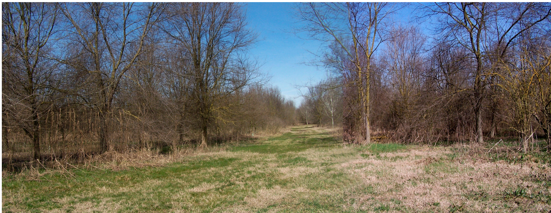
Ripresa n° 3 - Uno scorcio dell'impianto forestale del 1998 sull'isola