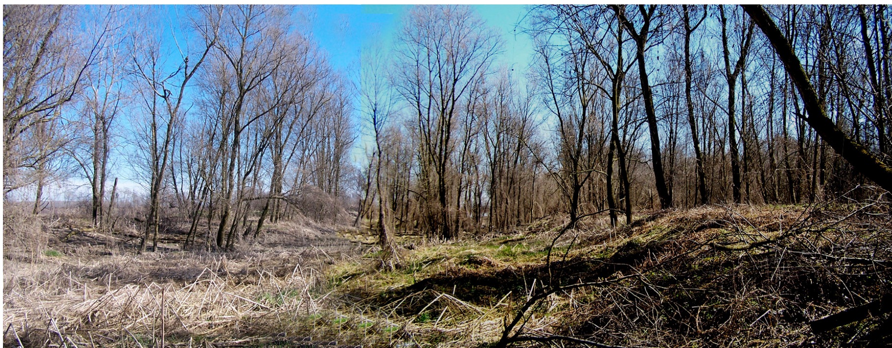
Ripresa n° 34 – l'habitat 91E0 al suo interno