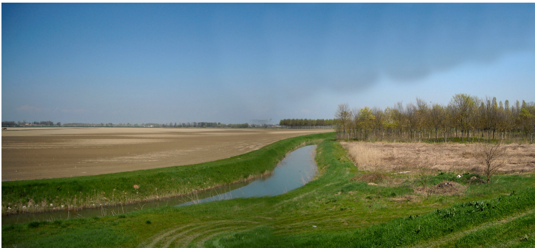
Ripresa n° 40 – Il Riolo, corridoio della rete ecologica del PTCP, privo di qualunque elemento di connessione ecologica.