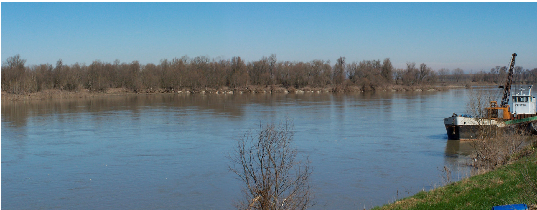
Ripresa n° 24 – la parte terminale est dell'habitat 91E0 sull'isola