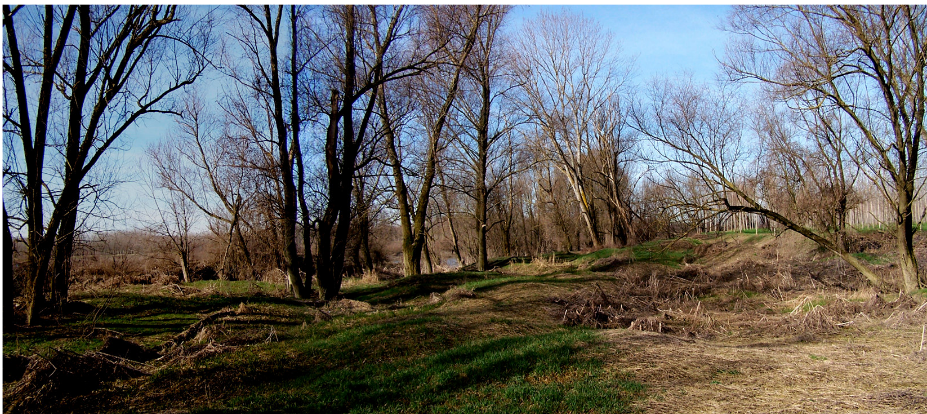
Ripresa n° 13 – l'habitat 91E0 nella golena nord