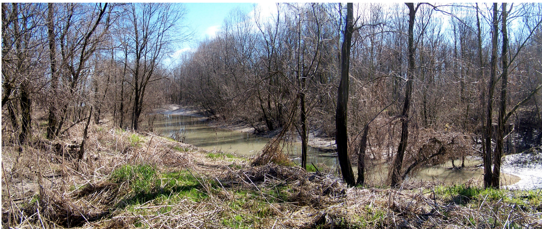
Ripresa n° 35 – l'habitat 91E0 in sponda destra del fiume.