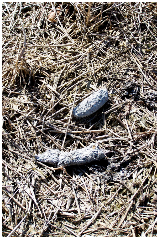
Ripresa n° 21 – Marcatura di Volpe sull'isola