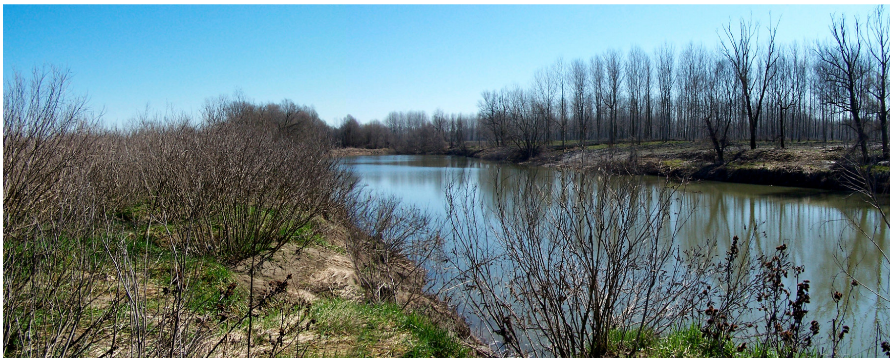
Ripresa n° 31 – Il tratto terminale della lanca del pennello.